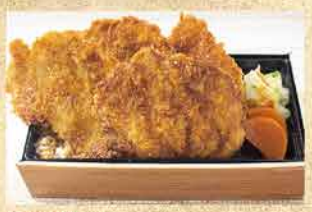
TK04 【希少部位使用】ヒレカツ丼 並 (3枚) 1,380円