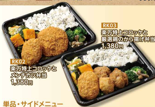
RK02 楽万特上コロッケと メンチカツ弁当 1,380円