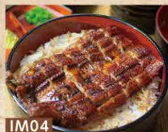
IM04 【並】ひつまぶし[半身] (出汁・薬味・香の物付き) 3,300円