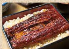
IM01 鰻重[半身](吸物・香の物付き) 2,800円