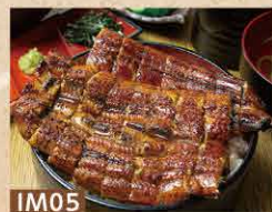
IM05 【上】ひつまぶし[志本] (出汁・薬味・香の物付き) 5,300円