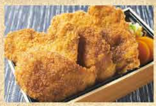
TK03 【新潟名物】タレカツ丼 特上 (6枚) 1,580円