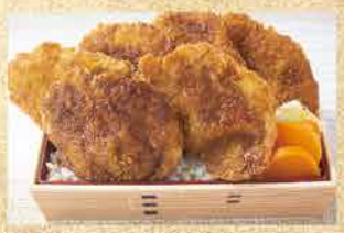
TK06 【希少部位使用】ヒレカツ丼 特上 (6枚) 2,180円