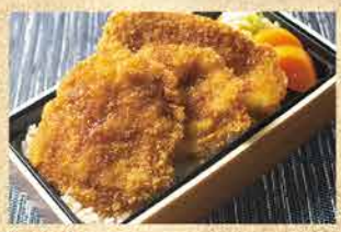
TK01 【新潟名物】タレカツ丼 並 (3枚) 1,080円