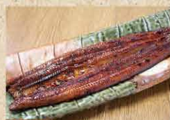
IM32 志本かば焼き 4,500円