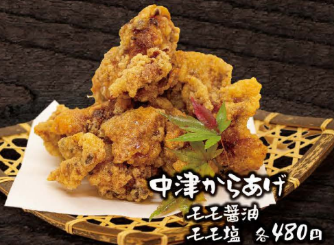
中津からあげ モモ醤油 モモ塩 各480円