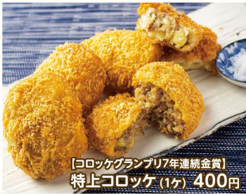
[コロッケグランプリ7年連続金賞] 特上コロッケ(1ヶ) 400円