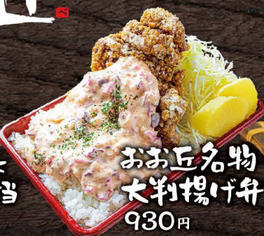
おお丘名物 大判揚げ弁当 930円