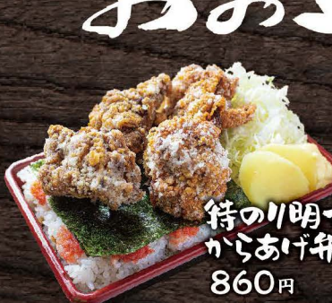
特のり明太 からあげ弁当 860円